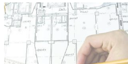
опоры под прокладку линий связи