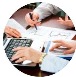
малый и средний бизнес