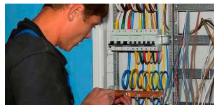
устанавливаем щиты учета электроэнергии