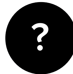
тут можете быть вы..