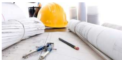
линии электропередач и внутренних электросетей